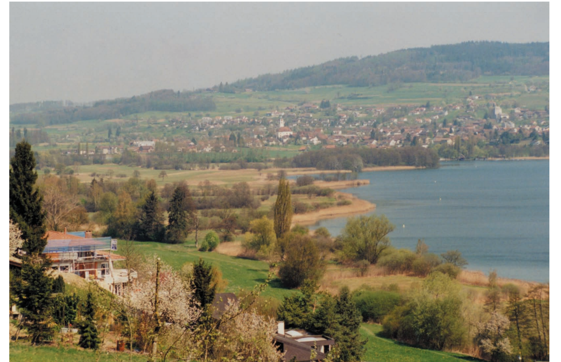
Kultur Landschaft Aargauer Seetal: Der See, Riedgebiete, Obstgärten,... attraktiver Lebensraum für Pflanzen und Tiere

Noch sind Reste der traditionellen Kulturlandschaft vorhanden – tragen wir Sorge zu ihnen!