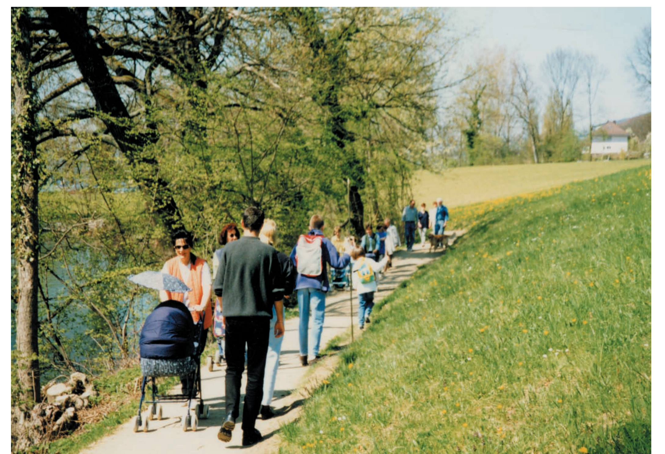
Von einer intakten Landschaft profitieren wir Menschen ebenso wie zum Beispiel der selten gewordene Gartenrötel (Bild unten)

Das Projekt wird durch den Landschaftsschutzverband Hallwilersee LSVH getragen. Projektpartner sind: Fonds Landschaft Schweiz FLS, Kanton Aargau (Abt. Landschaft und Gewässer sowie Abt. Landwirtschaft) und WWF Aargau. Um das Projekt längerfristig weiterführen zu können, ist KLAS auf weitere Projektpartner, Sponsoren und Spender/innen angewiesen!